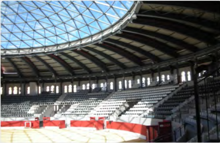
Plaza de toros de Villena